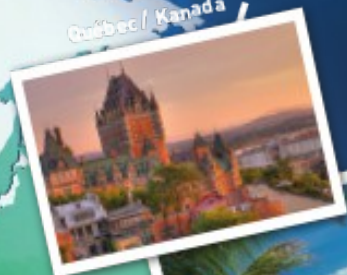
Québec / Kanada